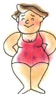
洋なし型 (主に皮下脂肪)