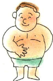
リンゴ型 (主に内臓脂肪)

体型（脂肪蓄積部位）は大変重要で、上半身型（リンゴ型、腹部）肥満の方が、下半身型（洋なし型、ヒップ）肥満より合併症が多いことが知られています。ウェスト・ヒップ比（ウェスト ÷ ヒップ）が男性 0.9 以上、女性 0.8 以上になると要注意です。